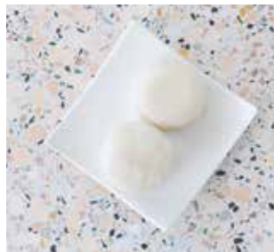
4.90 Kokos Mochi