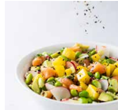
Poké Perfect mini bowl

Perfect voor een borrel, meeting of feestje. Prijs op aanvraag.