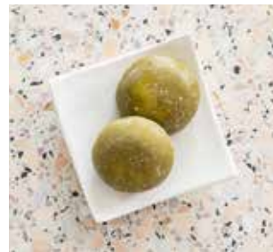
4.90 Matcha Green Tea Mochi