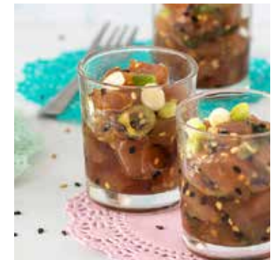
Gemarineerde tonijn amuse