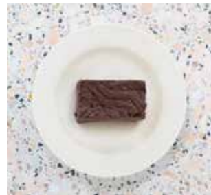
4.75 Chocolate Brownie