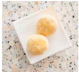
4.90 Mango Mochi