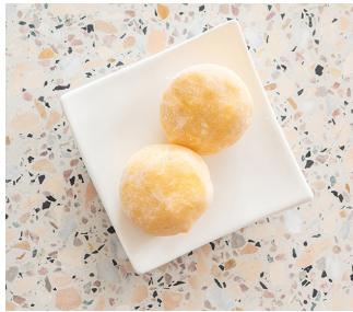
Mango Mochi 4.90