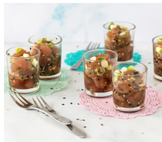
Gemarineerde tonijn amuse