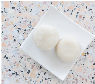
Kokos Mochi 4.90