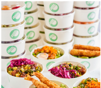
Poké Perfect mini bowl

Perfect voor een borrel, meeting of feestje. Prijs op aanvraag.