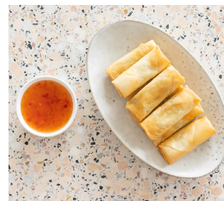
Mini Loempia's ✓ 4. 25