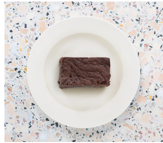
Chocolate Brownie 4.75