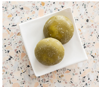
Matcha Green tea Mochi 4.90