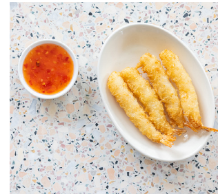
Shrimp Tempura 🐟 4. 75

Kleine bijgerechten om te delen. (Of lekker helemaal zelf op te eten)