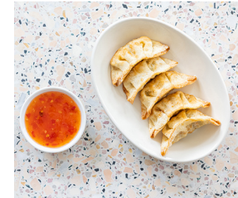
Gyoza ✓ 4. 25