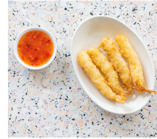
Shrimp Tempura 🐟 4. 50