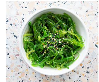
Zeeviersalade ✓ 3. 25