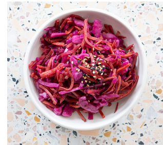
Pickled Veggies ✓ 3. 25