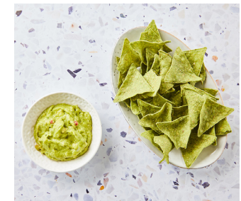
Zeewier nachos met guacamole ✓ 4. 25