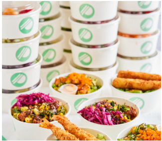
Poké Perfect mini bowl

Perfect voor een borrel, meeting of feestje. Prijs op aanvraag.